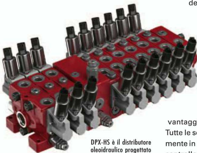
DPX-HS è il distributore oleoidraulico progettato da Walvoil per mini e midi escavatori.

Con questa novità, Walvoil presenta a Intermat 2018 una gamma ulteriormente integrata, le cui altre novità sono la pompa in ghisa 2SPW a brand Galtech adatta per quelle applicazioni per le quali le pompe in alluminio sono al limite delle loro performance; la serie dei distributori EX a brand Hydrocontrol, in grado di offrire al settore costruzioni e minerario elevate prestazioni in tema di stabilità ed efficienza energetica; il sistema di raffreddamento elettroidraulico fan drive di Galtech; i joystick analogici e CAN bus AJW e CJW, compatti ed ergonomici, adatti per tutte le macchine operatrici off-highway e per tutti i tipi di impugnature Walvoil.